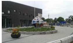
Etude de cas : Suède Ecole Ängelholm 600 élèves