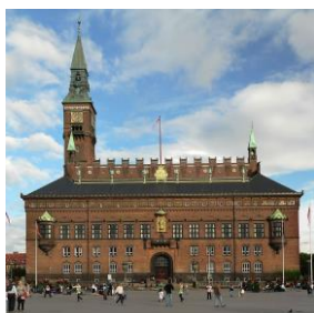
L'Hôtel de Ville de Copenhague

Organisation de l'habitat social au Danemark : les associations de logement social interlocuteurs de la ville.