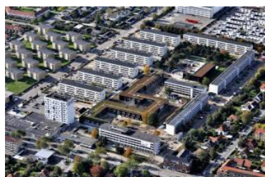
Gyldenrisparken (banlieue sud) Grands ensembles des années 60 470 logements – 900 résidents Quartier rénové géré par Lejerbo

Nouveaux services dans le logement social : les attentes des habitants