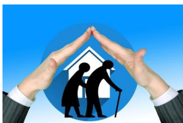
Centre technique pour le maintien à domicile des personnes âgées